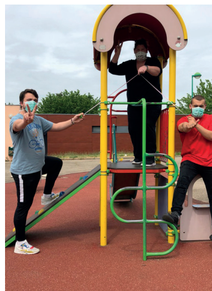
Les animateurs du centre de loisirs présents pour garder les enfants du personnel soignant.

Les deux groupes scolaires ont accueilli les enfants du personnel soignant n'ayant pu trouver un autre moyen de garde. La continuité pédagogique a aussi été assurée pour l'ensemble des élèves scolarisés à Fontaines-sur-Saône grâce aux enseignants et intervenants. Pour inscrire leurs enfants à l'école, les parents sont invités à prendre contact avec les directeurs d'école par téléphone :