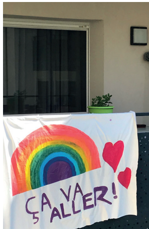
Lia, 14 ans, a réalisé une belle banderole pour redonner le moral à tous les Fontainois. Une belle attention de sa part !

Les actions d'habitants et les solidarités entre voisins n'ont cessé de voir le jour à Fontaines-sur-Saône. Retrouvez quelques exemples de ces gestes qui remontent le moral de chacun :